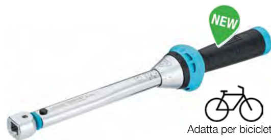
Adatta per biciclette