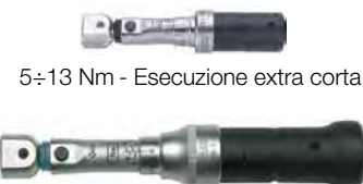
5 ÷ 13 Nm - Esecuzione extra corta