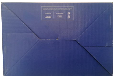
SCATOLA SCARPE SPARCO TEAMWORK in cartone blu-bianco-arancio e carta velina interna protettiva. Dimensioni 343x188x123 mm Indicazioni per il riciclo valide per l'ITALIA sul fondo (PAP20)