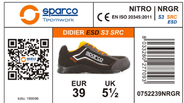
ETICHETTA ESTERNA SCATOLA applicata sul lato predisposto della scatola, riporta le caratteristiche del prodotto, Certificazione, numero di lotto, codice prodotto, codice QR e codice a barre. Dimensioni 105x60 mm