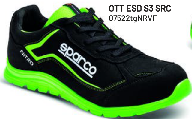
OTT ESD S3 SRC 07522tgNRVF