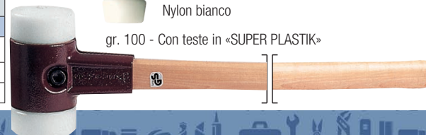
gr. 100 - Con teste in «SUPER PLASTIK»