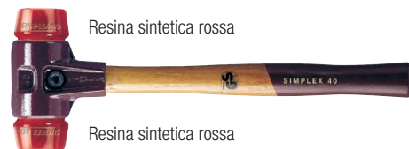
Resina sintetica rossa