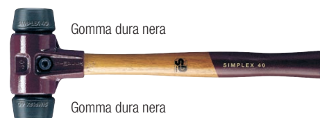
Gomma dura nera