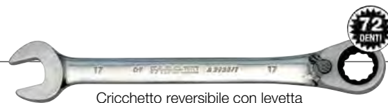
Cricchetto reversibile con levetta