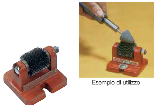
Esempio di utilizzo