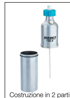
Costruzione in 2 parti