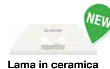
Lama in ceramica