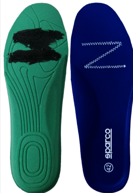
SOLETTA REMOVIBILE antistatica in morbido poliuretano con termoformatura ergonomica.