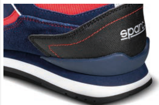
RINFORZO in TPU al tallone per una migliore stabilità e maggiore resistenza.