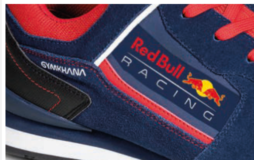
LOGHI e DECORAZIONI realizzati in microiniezione