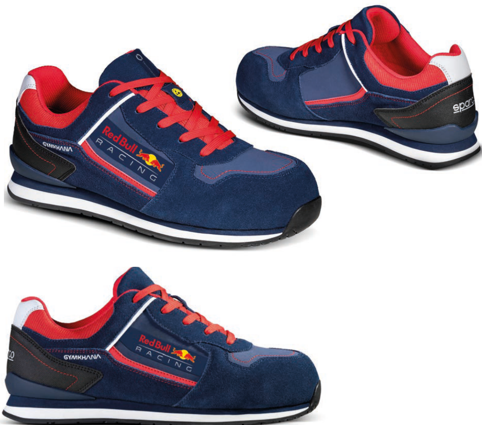
RED BULL ESD S3 SRC HRO 07535RBtgBMRS